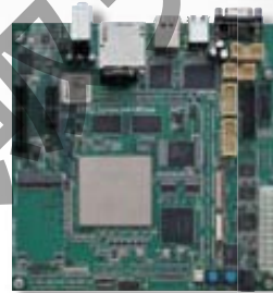
標準タイプ 型番: KZM-CA9-01-STD 標準価格 550,000 円 (税込577,500円)