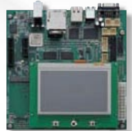
LCD付属タイプ 型番: KZM-CA9-01-LCD 標準価格 600,000 円 (税込630,000円)